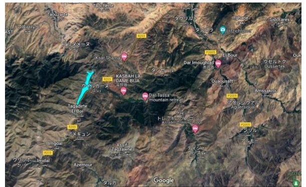
ウィルガーヌダム 2023年11月11日

巨大なダムが目に入った。ウィルガーヌには、モロッコに数十基備えられているダムのうちのひとつによって、大きな湖ができてあがっている。ところが、モロッコ全体からすればいくつもあるダムのうちのひとつに過ぎない。9年前ほどに建設された。アトラス山脈ふもとの湖において、生態環境の生態系をこわした張本人である。村人は魚料理も好む。ダム近辺の魚は天然ではなく別の場所から稚魚を持ち込み養殖している。ウィルガーヌダム建設の目的は都市マラケシュへの電力供給である。他国と同様、便利な生活と引き換えに自然を売り渡した贖罪は将来しつぺ返しを受けることだろう。かつて湖があった場所の「村人は追い出された」と寂しげに語る住民がいた(11月10日地元住民談)。