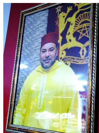
モロッコの現国王ムハンマド6世(1963年生 在位:1999年7月23日-現在)

民衆のために福祉や医療制度などを充実してくれた憐れみ深い王という印象があるようだ。王は地中海沿岸の首都ラバトの王宮に居住されている。アフリカで正式に王制なのはモロッコだけである。筆者は2019年6月3日、ガーナ国ワ・ナ宮殿に集まった11地域の長官を束ねられるフセイン・セイドウ・ペルプオ4世[1950年2月28日生]という王にお目通りがなかったことがあった 5 。ガーナでは、ワだけでなく王が地域毎にいる。現在のモロッコでは、初等、中等、高等教育において公的また私的な教育機関が存在する。モロッコの公用語はアラビア語と後述するアマジグ語(ベルベル語)である。