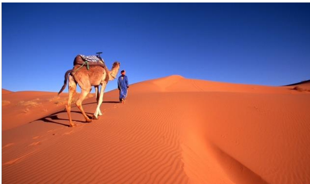
モロッコの北は地中海, 南にはアフリカ大陸の三分の一を占めるサハラ砂漠。モロッコの砂漠は赤砂が特徴である。