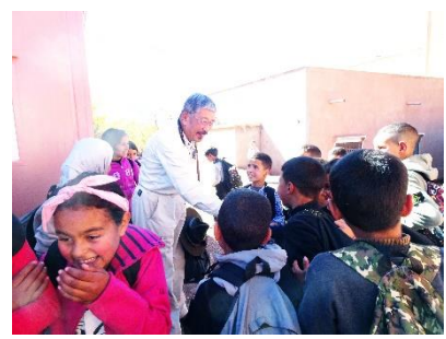
アスニ小学校の授業で飛び入り教師 2023年11月11日。

西側諸国、「グローバルノース」(北半球を中心とする経済的裕福な国々)とモロッコを比較すると、インフラストラクチャー( infrastructure 略称・インフラ)が極端におくれている。しかし、機能、能率、便利を追求した都会生活のように窒息しそうで人間の本性を失うような競争はない。モロッコの山の麓には、人間らしい生活空間と悠久の時間が流れている。