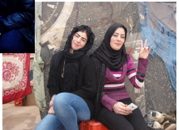
2018年2月8日 アルサール近くのラッカからの難民