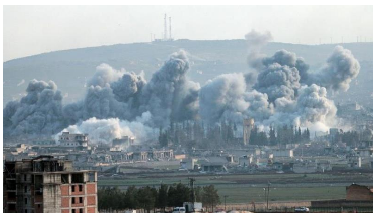
2017年8月21日 米軍によるラッカ攻撃

過激派組織「イスラム国」(IS)のナイフによる斬首を悪魔の所業と世界に恐怖感を植えつける宣伝をしながら、空爆により無差別にシリア市民を殺戮するアメリカは正義と言い切れるでしょうか。日本の報道では絶対にわからない闇があります。