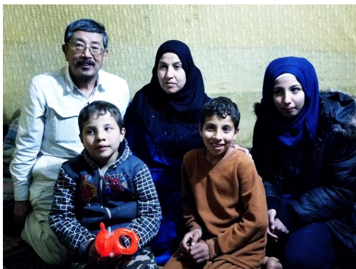
2017年12月28日 ラッカから脱出した難民 マリッシュ

市民ジャーナリスト集団“RBSS”(Raqqa is Being Slaughtered Silently/ラッカは静かに虐殺されている)は「イスラム国」の本拠地であったシリアのラッカを2017年追い出されました。ラッカの死者は3259人に及びます。内訳は「イスラム国」による被害者は548人にすぎません。残りの63パーセントは米軍などの空爆の犠牲になった人々です。