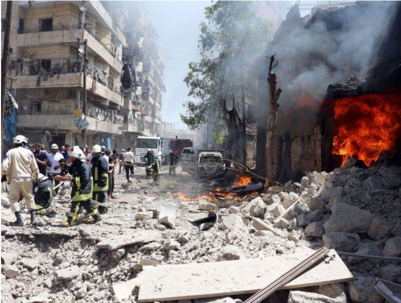
シリア第2の都市アレッポの惨状

アレッポで生産されていた石けんは世界でもっとも有名です。「イタリアにこの石けんの作り方を教えたのは、フェニキア人(今のシリア)です」 20) 。