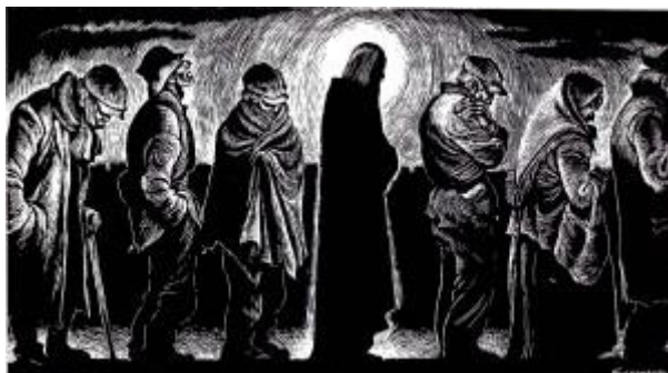
フリッツ・アイヘンバーグ Fritz Eichenberg [1901-1990] 版画『炊き出しの列に並ぶイエス』