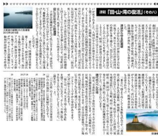
拙稿 季刊誌『支線』No.10(神戸国際支線機構2015年3月 4頁)。