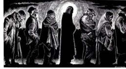
炊き出しに並ぶキリスト